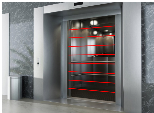
СИСТЕМА БЕЗОПАСНОСТИ В АВТОМАТИЧЕСКИХ ДВЕРЯХ