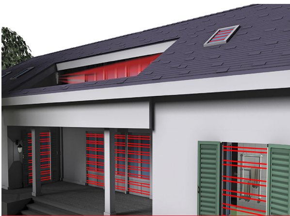
СИСТЕМА ЗАЩИТЫ ОТ НЕСАНКЦИОНИРОВАННОГО ПРОНИКНОВЕНИЯ