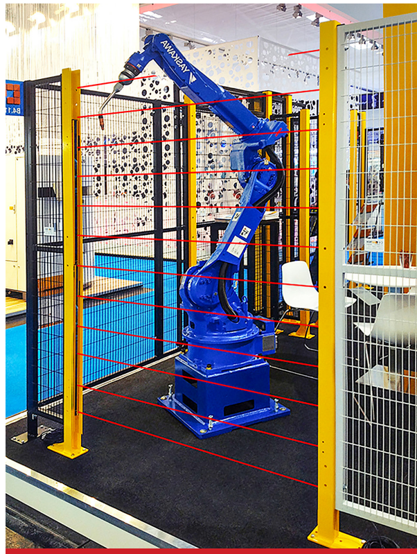
КОНТРОЛЬ ДОСТУПА В ЗОНЫ ОПАСНОСТИ