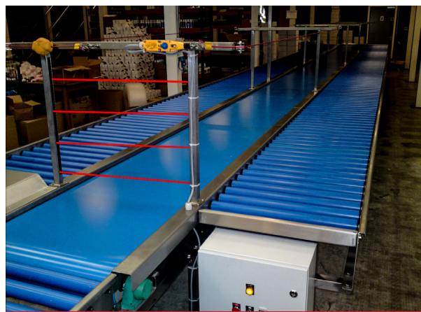
УЧЁТ НА КОНВЕЙЕРНОМ ПРОИЗВОДСТВЕ